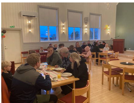
Lyxfrukost i missionshuset 2022

Mer information kommer på hemsidan och Vännfors Vänner på Facebook.