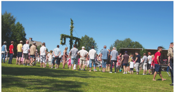
Midsommar i Vännfors

Vill du vara med och klä stången? Kom ca kl 12!